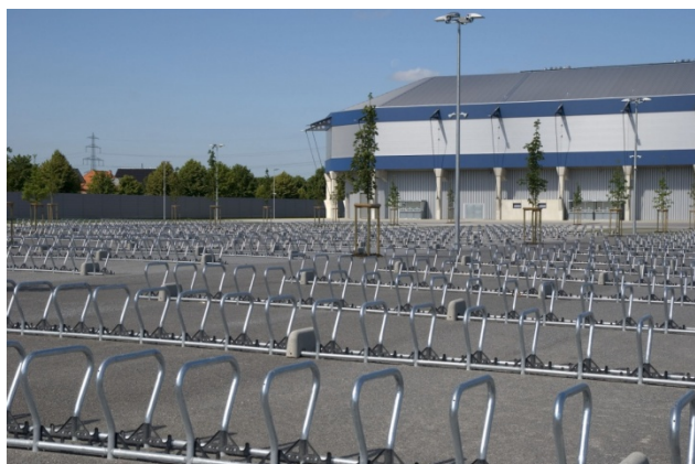
Beta Basis XXL