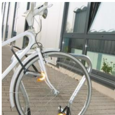
Beta Basis XXL