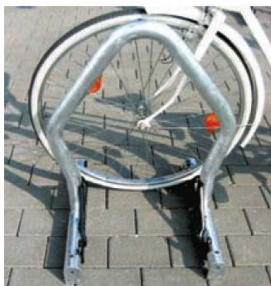
Beta Basis Caro