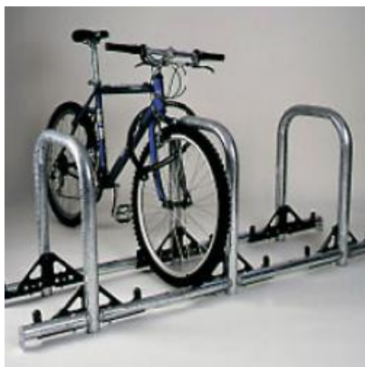
Beta Basis Classico