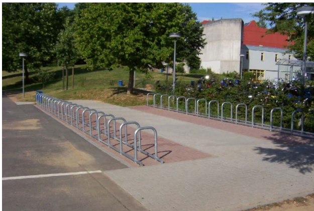
Beta Basis Classico.

Beta Basis är en förenklad version av High-end versionen Beta XXL och har sitt ursprung i den klassiska stödbågen. Beta Basis är överlägset det klassiska cykelstället. Beta Basis ger bra stöd för framhjul och framgaffel på cykeln och ger bra möjligheter till att låsa fast cykeln. Tillvalet Focus ger extra styrning vid parkering av cykeln.